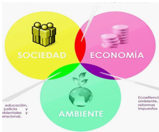
Figura 2: Modelo conceptual de los tres ejes del desarrollo Sustentable (Quintana et al., 2011).

El principio de sustentabilidad emerge en el contexto de la globalización como la marca de un límite y el signo que reorienta el proceso civilizatorio de la humanidad, se comprende que el desarrollo debe centrarse en los seres humanos y no sólo en los índices económicos. La sustentabilidad es la equidad ecológica, económica y social, tanto para las presentes como para las futuras generaciones humanas (Rivera, 2006).